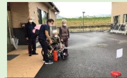
水消火器を使った消火訓練