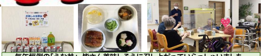
毎年恒例の「うなぎ」 皆さん美味しそうに召し上がっていらっしゃいました。