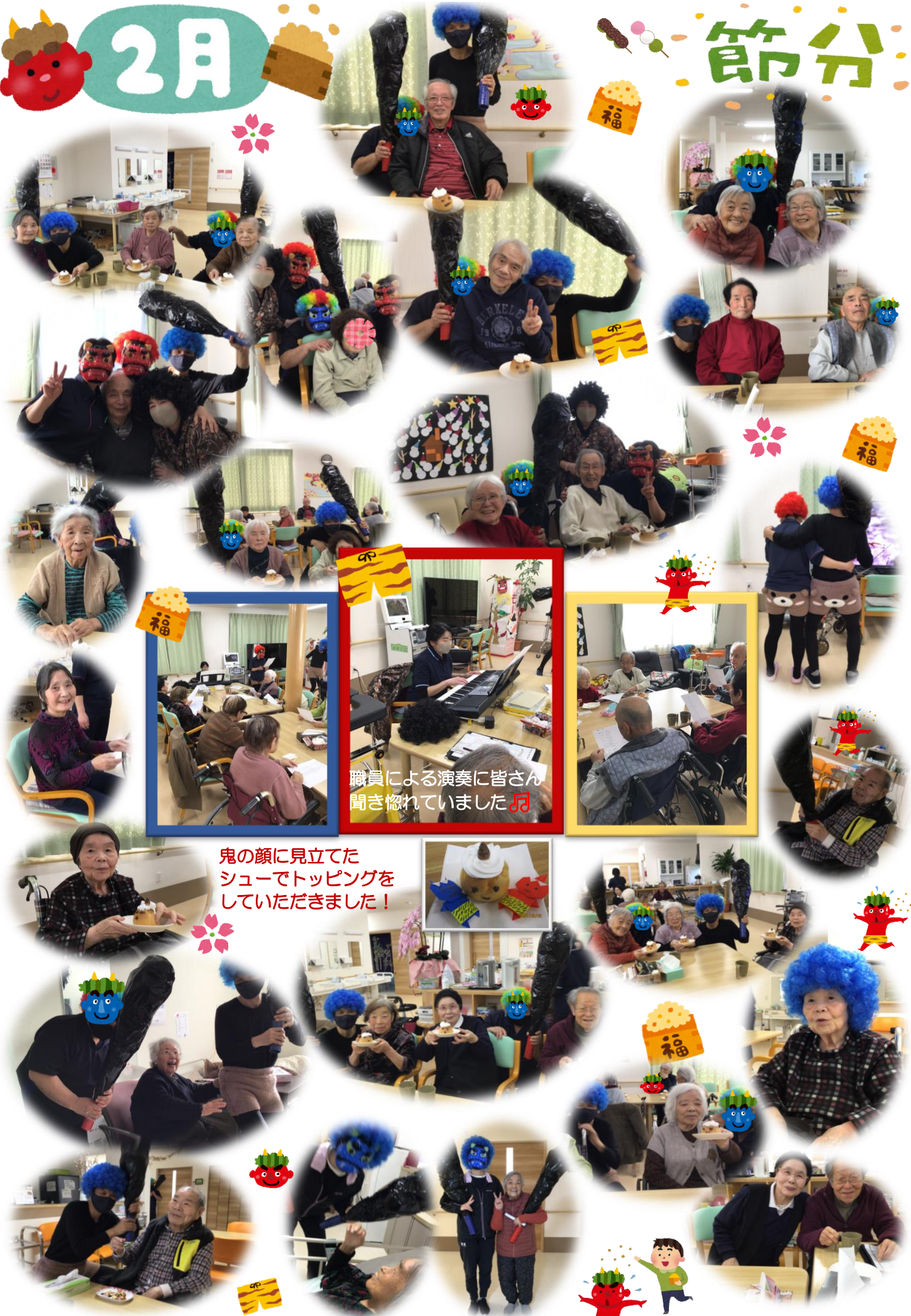
職員による演奏に皆さん聞き惚れていました🎵