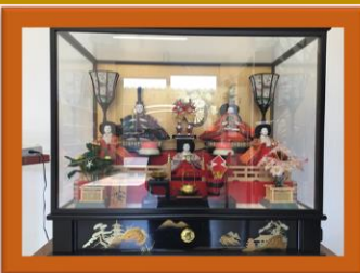
おひな祭り会の様子