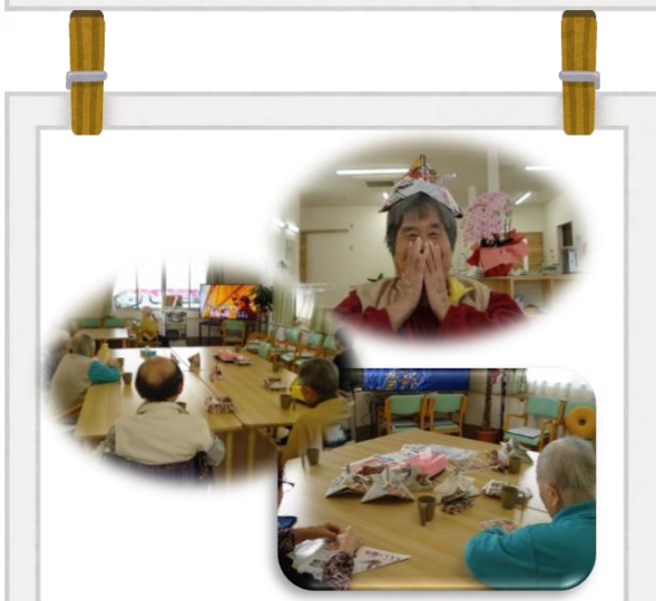
デイサービスにて兜づくりやカラオケを楽しまれました。皆さん、兜をかぶってとても良い笑顔を見せてくださいました。