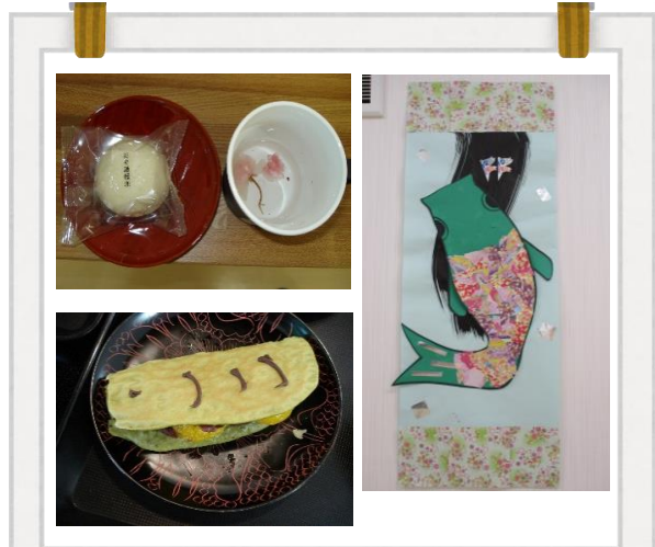
デイサービスにてお花見会、端午の節句の行事を行い、桜茶や若鮎どら焼きを皆でいただきました。