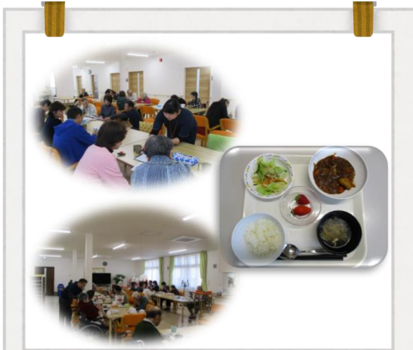
運営懇談会（H31.4.20開催） 昼食を準備し、入居者様と一緒に召し上がっていただきました。

このたび、ゆとり新聞第1号を作成致しました。4月からの活動内容や様子をまとめました。ホームページも立ち上げ、ブログも更新しております。そちらもぜひご覧ください。※「ゆとりハウス」で検索すると出てきます。